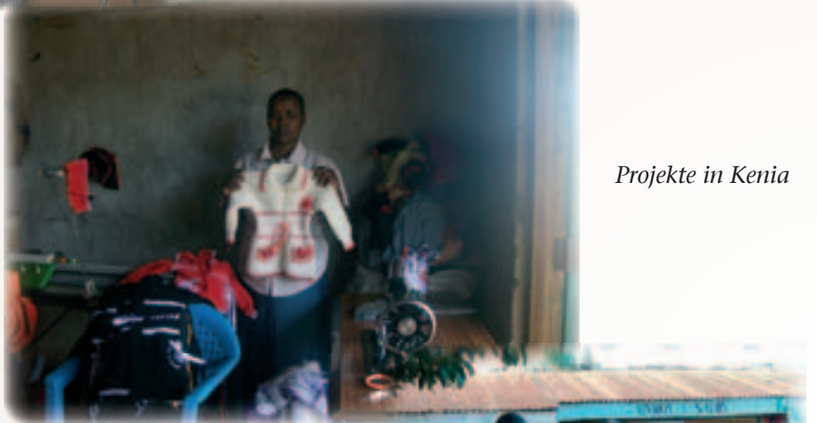
Projekte in Kenia